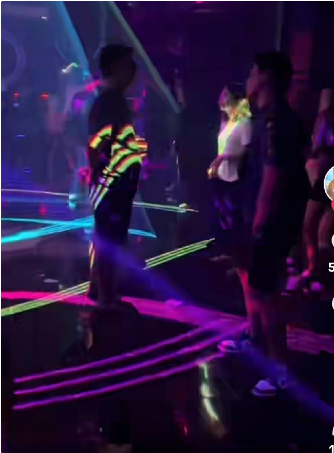
Sebanyak tiga orang tersangka diamankan bersama ratusan butir ekstasi yang diduga kuat diedarkan kepada para pengunjung klub malam tersebut.