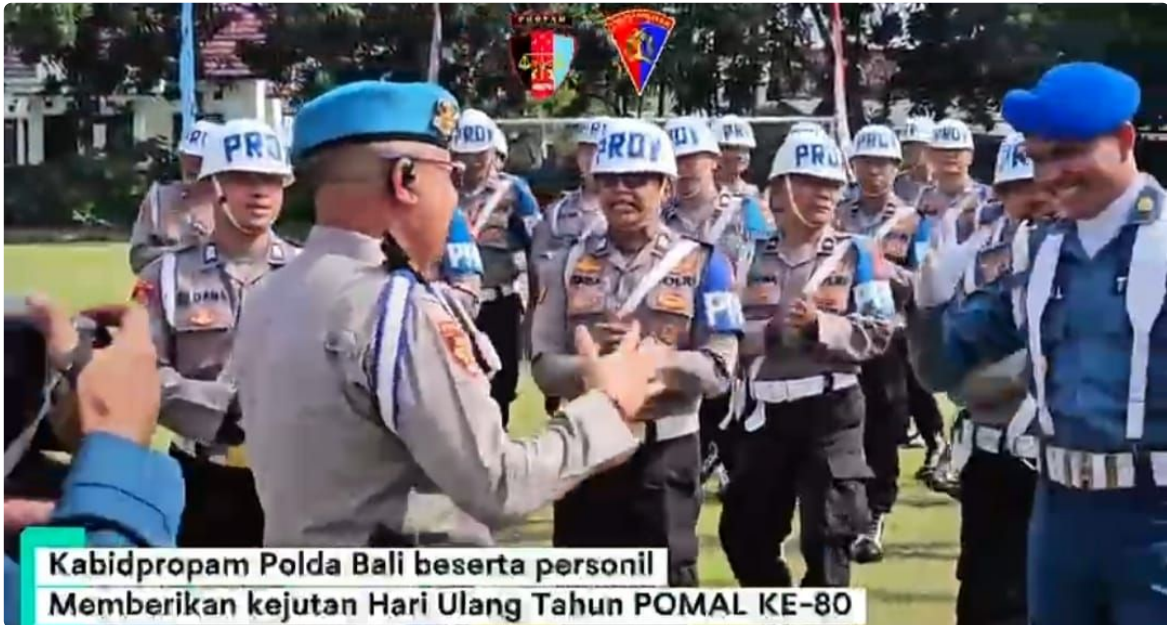
Kabidpropam Polda Bali beserta personil Memberikan kejutan Hari Ulang Tahun POMAL KE-80

Suasana penuh keakraban pun terlihat saat kejutan tersebut disambut hangat oleh para personel POMAL.